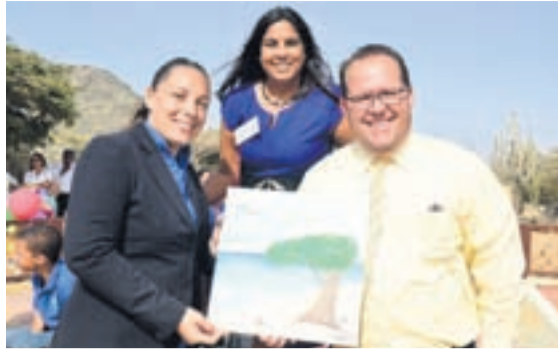
Aruba Bank a contribui cu speeltu in Les a B12